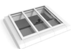
Kast onderaan (binnentoepassing)