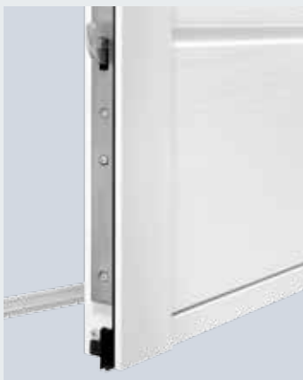
Boven en onder telkens één draaigrendel

NT80-2: schuifgrendel Optioneel: deurvastzetter