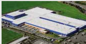
Hörmann KG Ichtshausen, Duitsland