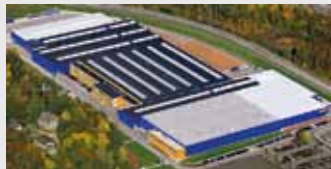
Hörmann KG Eckelhausen, Duitsland