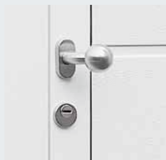
Roestvrijstalen garnituur (optioneel)