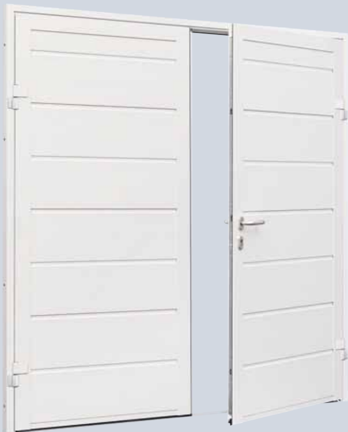
Garagedeur NT 60-2