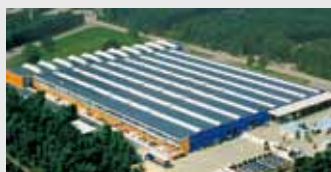
Hörmann Genk NV, België