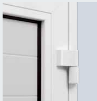
3-dimensionaal regelbare scharnieren