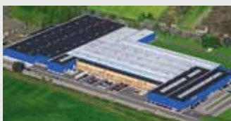
Hörmann KG Werne, Duitsland