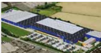
Hörmann KG Brandis, Duitsland