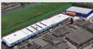
Hörmann Alkmaar B.V., Nederland