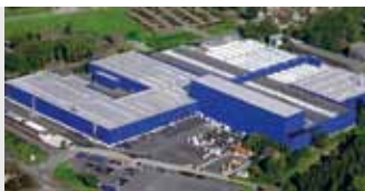
Hörmann KG Amshausen, Duitsland