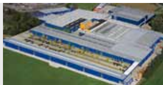
Hörmann KG Brockhagen, Duitsland