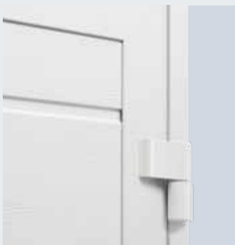
3 tweedelige scharnieren