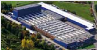
Hörmann KG Freisen, Duitsland