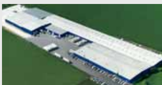
Hörmann LLC, Montgomery IL, USA