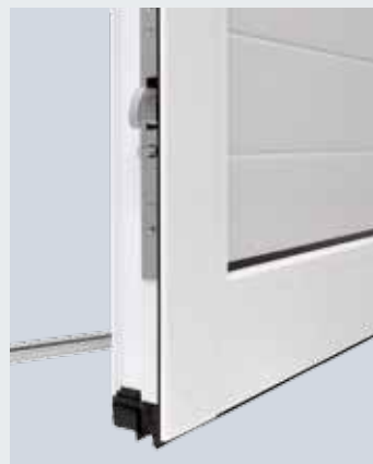
5 vergrendelingspunten en 3 draaigrendels