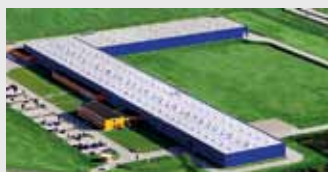
Hörmann Legnica Sp. z o.o., Polen