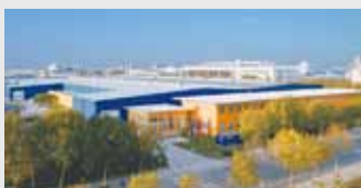
Hörmann Beijing, China