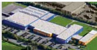
Hörmann KG Antriebstechnik, Duitsland