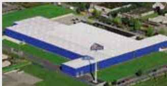
Hörmann KG Dissen, Duitsland