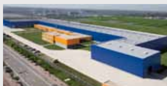
Hörmann Tianjin, China